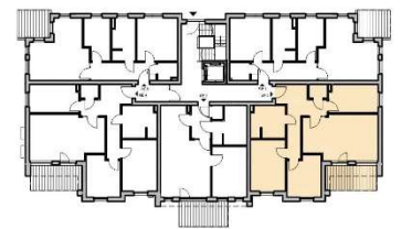
Haus 4 - EG