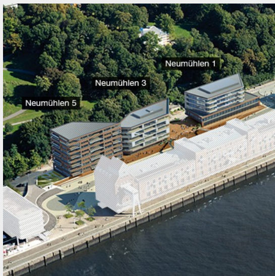
Das Elbdeck in Hamburg-Neumühlen 1, 3, 5